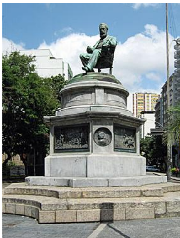
Figura 04: Monumento público a José de Alencar; escultor: Rodolpho Bernardelli, 1897, Rio de Janeiro.

que recebeu o seu nome, na cidade do Rio de Janeiro. Um evento marcado com toda a pompa que lhe era devida, homenageado por bandas e discursos, presenciado pelo então presidente da república Prudente de Moraes, escritores ilustres e seus familiares 13 . Este foi o primeiro monumento erguido na capital do Brasil para honrar publicamente a memória de um literato. (FIGURA 04).