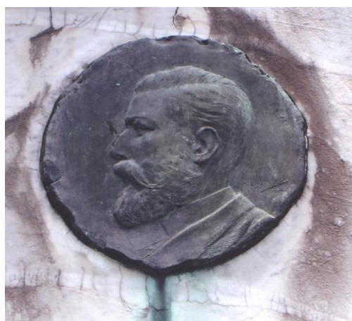
Figura 03: Detalhe, Efígie de José de Alencar.