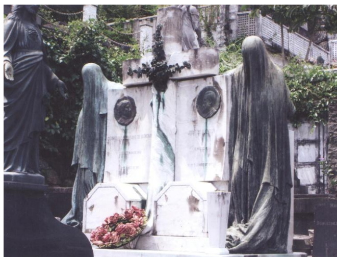
Figura 01: Túmulo da família de José de Alencar. Escultor: Rodolpho Bernardelli, Cemitério São João Batista, Rio de Janeiro.